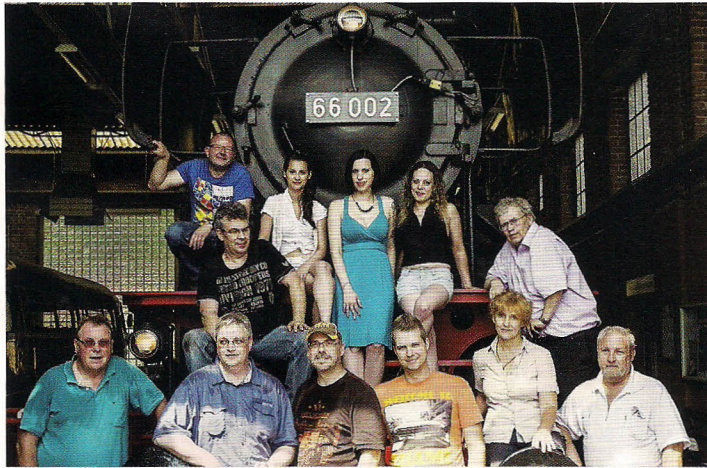
Fotografen und Models im Eisenbahnmuseum Bochum

Der Phönix ist eigentlich ein Vogel der griechischen Mythologie, der verbrannte, um aus seiner Asche wieder neu zu entstehen. Die Redewendung „Wie ein Phönix aus der Asche“ nutzt man heute noch häufig für das schon verloren Geglaupte, aber Wiedergefundene. Woher und von wem der Stammtisch seinen Namen bekam, ist - laut seinen ältesten Mitgliedern - nicht mehr nachvollziehbar. Mittlerweile aber besteht „phoenixer.de“ seit 2008 und zählt 57 weibliche und männliche Fotografen.