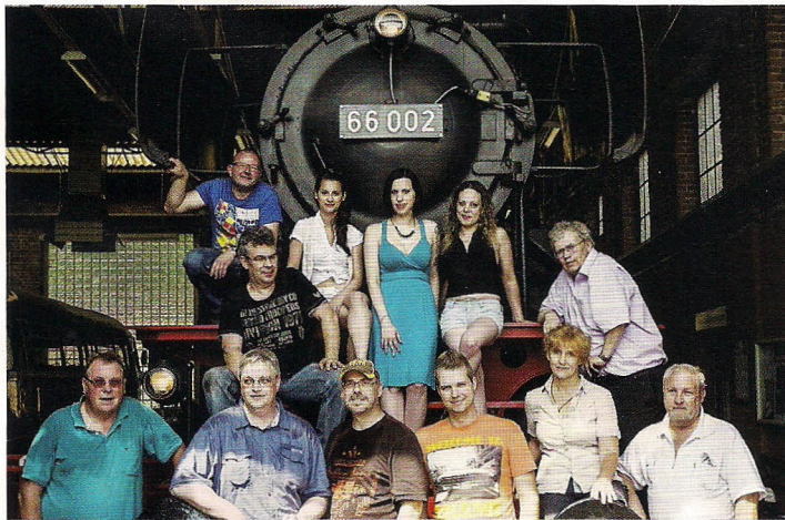
Fotografen und Models im Eisenbahnmuseum Bochum

Der Phönix ist eigentlich ein Vogel der griechischen Mythologie, der verbrannte, um aus seiner Asche wieder neu zu entstehen. Die Redewendung „Wie ein Phönix aus der Asche“ nutzt man heute noch häufig für das schon verloren Geglaupte, aber Wiedergefundene. Woher und von wem der Stammtisch seinen Namen bekam, ist - laut seinen ältesten Mitgliedern - nicht mehr nachvollziehbar. Mittlerweile aber besteht „phoenixer.de“ seit 2008 und zählt 57 weibliche und männliche Fotografen.